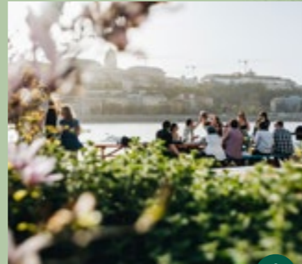
Vissza a Dunához