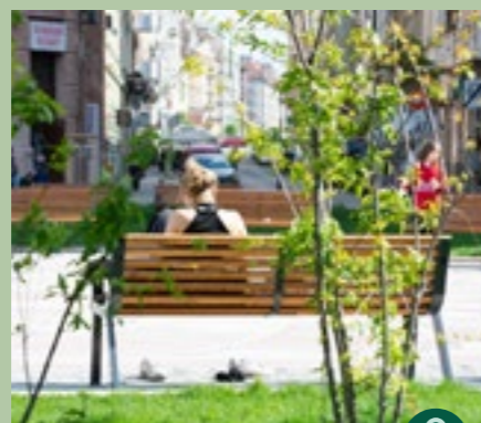
Úton, útszélien zöld