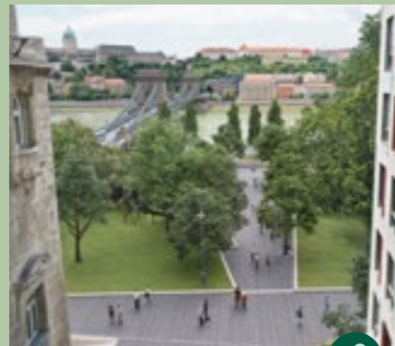
Séta a belvárosban